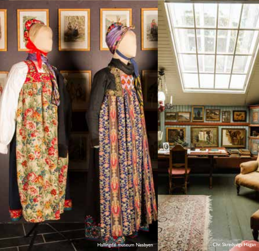
Hallingdal museum Nesbyen