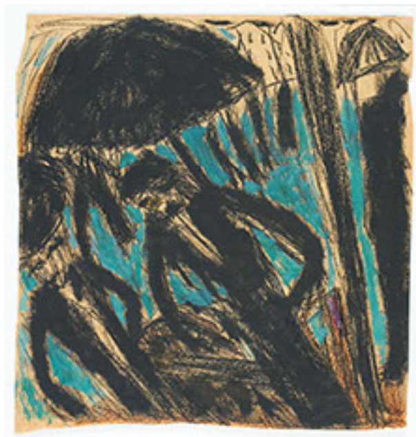
Terje Bergstad Regnvær

Terje Bergstad's stiftelse Katalog nr 31