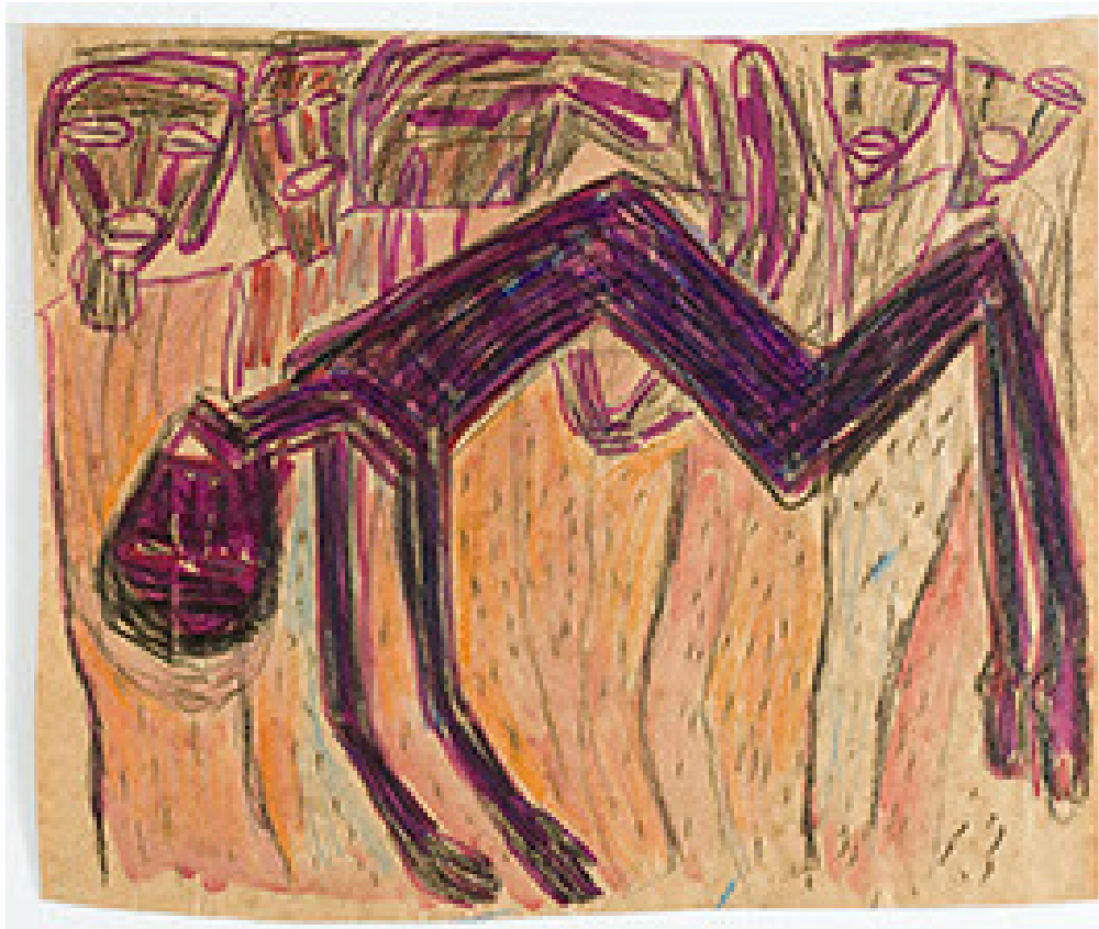
Terje Bergstad Den døde

Terje Bergstad's stiftelse Katalog nr 41