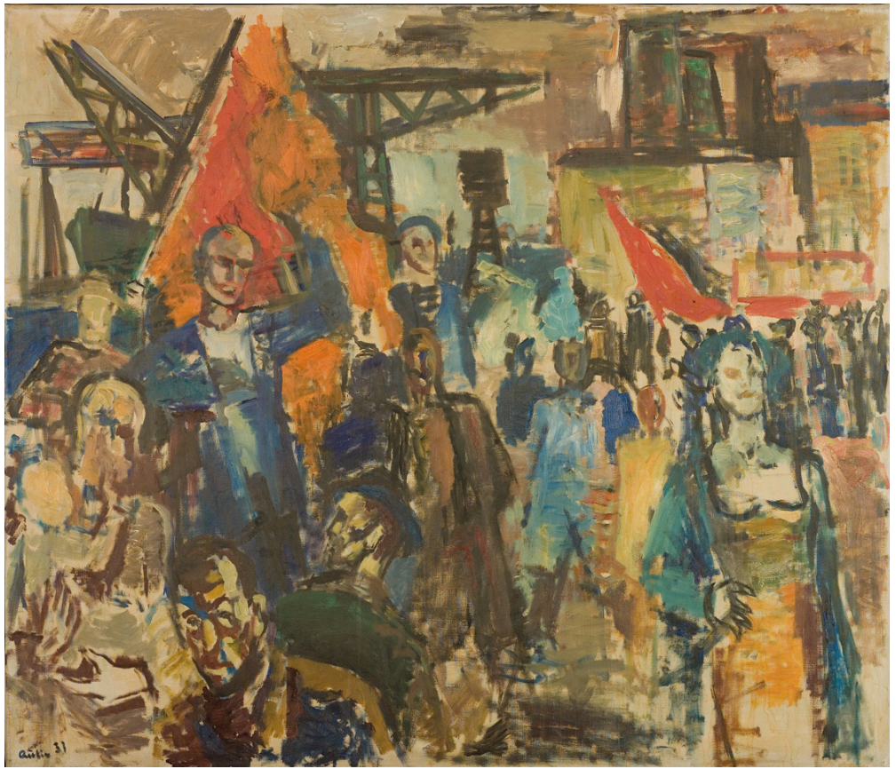
Reidar Aulie Fargeutkast til Tendens, 1931

”Både ved sin tittel og sitt vidtfavnende motiv er bildet blitt stående som selv programbildet for tendenskunstperioden. Bildet viser ingen historisk hendelse, men er en allegori over tidens politiske strømninger, samfunnets brytninger og enkeltmenneskets egne kvaler i valget mellom egennyttens og fellesskapets krav. Som ramme for disse omfattende temaene har Aulie valgt en tett befolkning plass omkranset av skipsverft, bygårder og fabrikkbygninger i det fjerne. Gjennom en rekke virkemidler peker bildet i en bestemt retning; mot et sosialistisk samfunn. Tidens krav var Aulies mål”