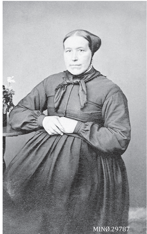
Portrett av kvinne. Gisen som var barnepike hos Tangen på Tønset. Foto: Elen Schomragh. Nordøsterdalsmuseet 29787.