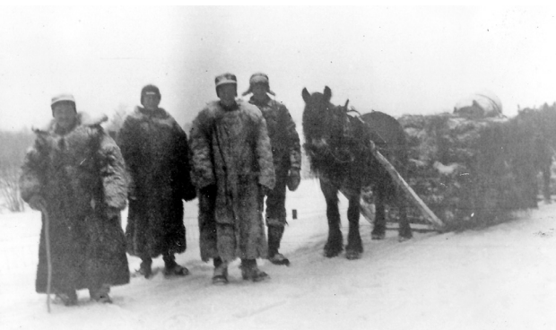
Her på tur heim.