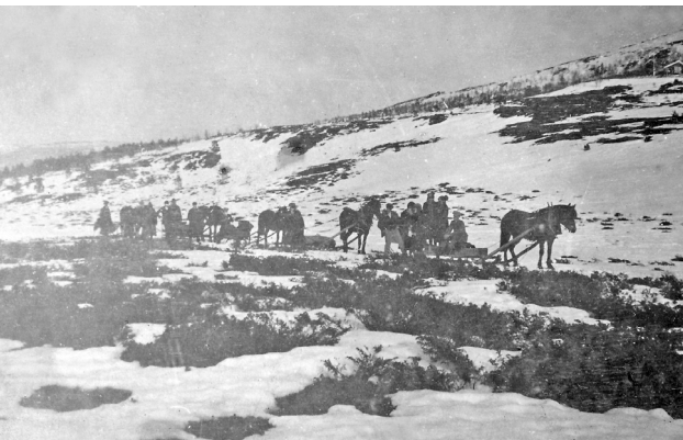
P sketur i Einunndalen. Skj rtorsdag 1.april 1926

I 1919 har Steen kome i lag med "D lhaug, Steimoeggen, Kveberg og Aukrusts, T mmer ien og Haldostuen, i alt 14 mand og 15 heste". Storsteigen har hatt med ny h ypresse og skal presse opp alt h yet f r dei lunner det fram. Dei skal og kj re innover 600 kg kunstgj dsel, og naboene er spente p  korleis det vil virke p  setervollen.