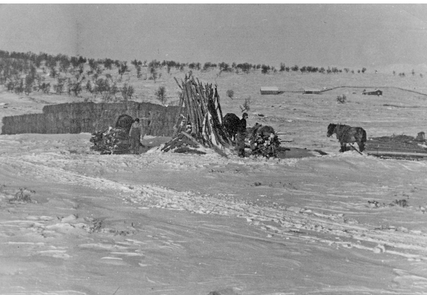
Ved Gjeltsetra. Her lesses høybunter av og vedbjørk på.

Var det vanleg lunning, tørna dei ofte ut i 3tida frå innst i dalen. Hestene måtte stelles eit par timer før. Lassa ble ferdiglesst kvelden føreåt.