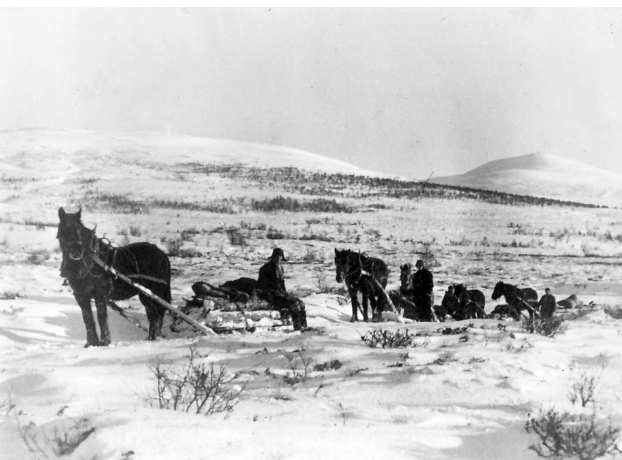
På tur innover til Fjellkjøringa i Einunndalen.