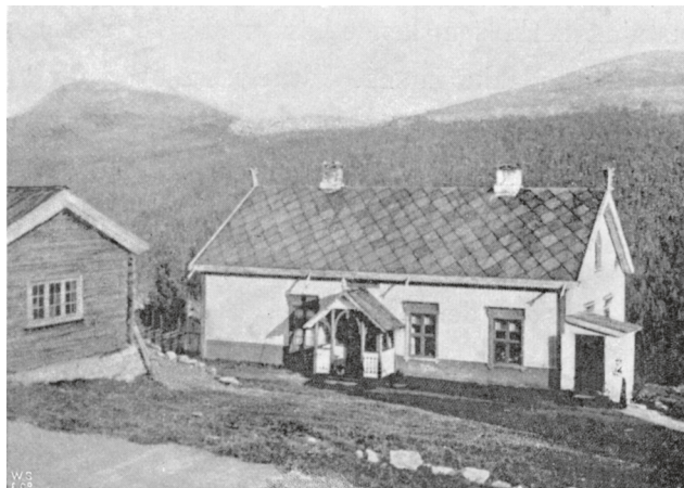
Prestegarden i Sollia, fra boka Skisser fra fjeldbygden.