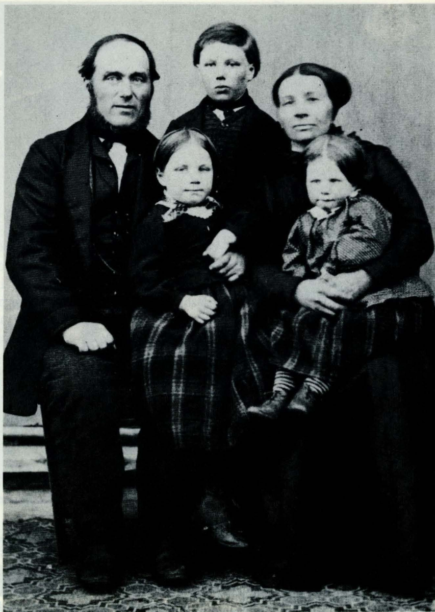
1857-1858 De barn og voksne Teigen, som het Okshaugen. De Familiebilette frå Flaten i Alvdal. (31023)