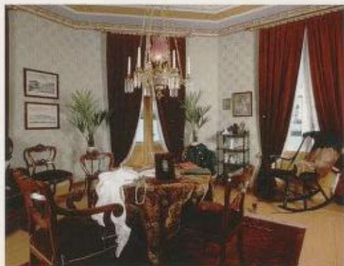
Fig. 7. (over): Noras salong i «Et dukkehjem – 1879».