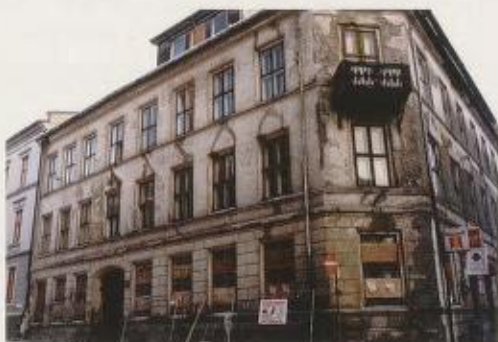
Fig. 2. Wessels gate 15 før rivning i 1999.