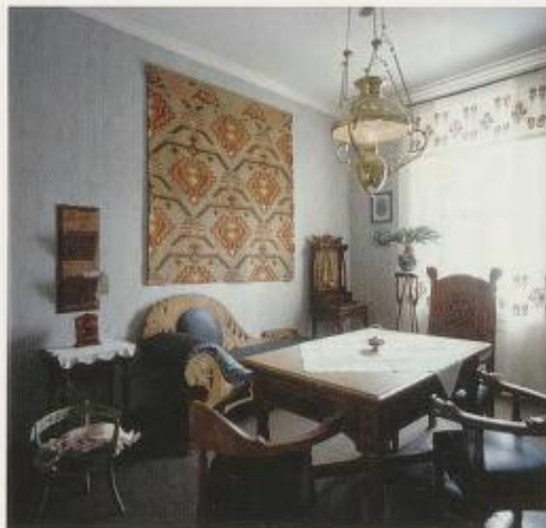
Fig. 4. Stua i «Ein norsk heim i ei ny tid – 1905».

og Venstrevelgere, modernister og tradisjonsdyrkere. Dette preger hjemmet hvor ungdom, dragestil og husflid står side ved side.