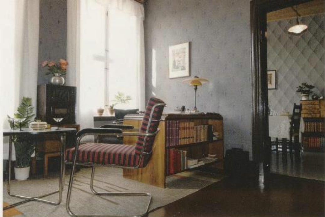
Stua i «Slik vil vi bo – 1935».