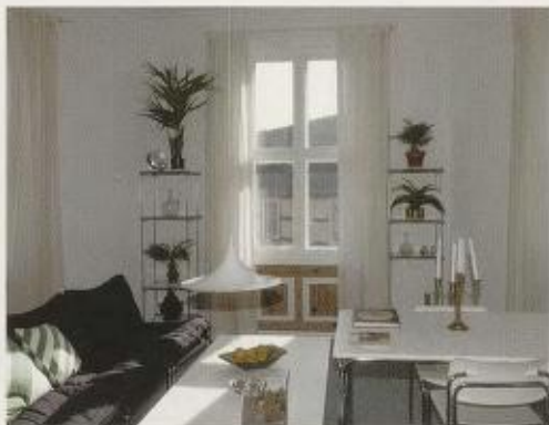
Fig. 8. (over t.h.) Stua i «Bonythjemmet – 1979».