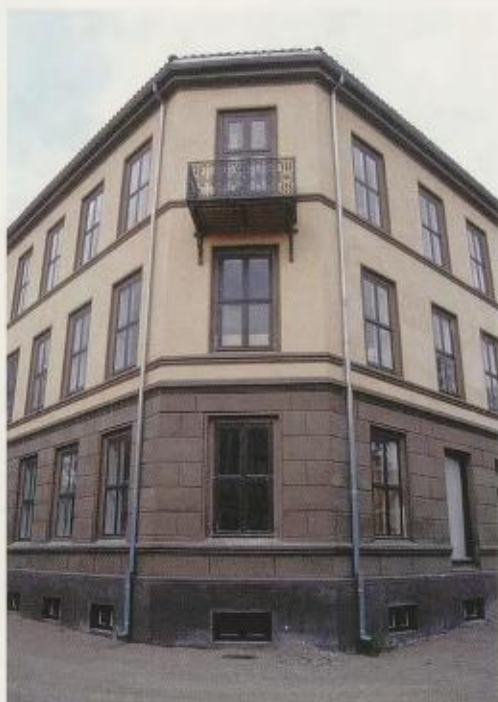
Fig. 1. «OBOS-gården – Wessels gate 15» gjenoppført på Norsk Folkemuseum i 2001.

Med plasseringen på Meyerløkka, midt mellom øst- og vestkant, lå gården i et geografisk og sosialt grenseland. Folketellingene viser at det har bodd både «bra folk» og «pene mennesker» her, både arbeidere og handelsborgere, men først og fremst har strøket og gården vært en småborgerlig bastion. Den varierte beboersammensetningen har gjort Wessels gate 15 til et godt utgangspunkt for å vise byhjem i ulike sosiale lag.