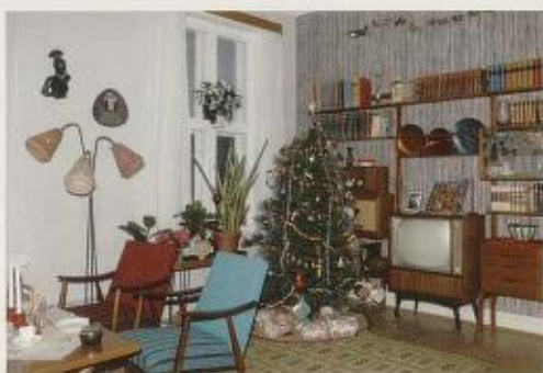
Fig. 9. Jul i stua i «Teak, TV og tenåringer – 1965».

på Frilandsmuseet der en fra 1960-tallet valgte å gjenskape autentiske bomiljø fra husenes siste år. Museet satte «tiden i stå» ut ifra den kjennskap en hadde til tidlige beboeres forhold. 9