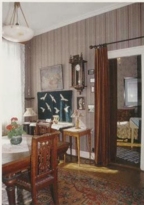
Fig. 3. Spisestua i «Gunda Eriksens hjem – 1950». Foto: Anne-Lise Reinsfelt, Norsk Folkemuseum.

Møbleringen følger fotodokumentasjonen av Gundas originale hjem, men er tilpasset planløsningen i Wessels gate 15. I finstua står spisestuemøblemet av eik i sen nyrenessanse som Gunda og Olaf Eriksen