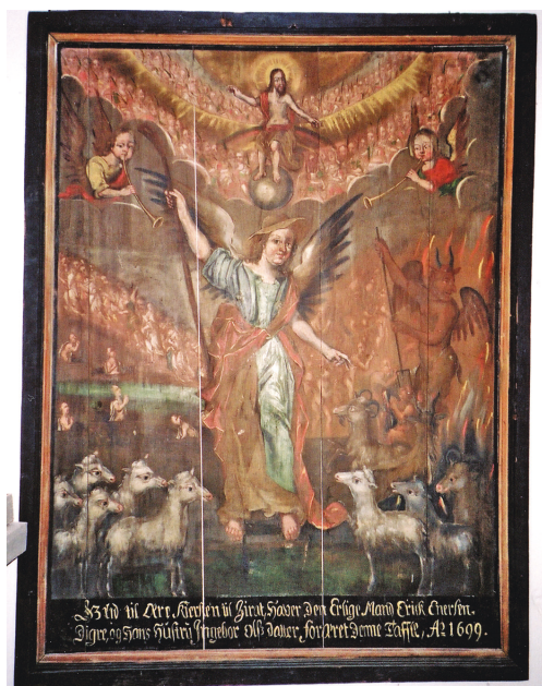
Dommedagstavle fra Singsås, nå Glomdalsmuseet, fra 1699, samme motiv som på tavla i Vingelen.

Fargeholdningen i interiøret fra Singsås kirke 15 ligner meget på slik det opprinnelig var i Vingelen.