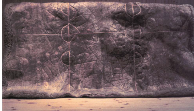
Skinnfell frå Sandvoll, Tynset (prnøt 0051). Fellen sett frå vranga. Her ser ein korleis fellen er bøtt. For å utnytte skinna mest mogleg måtte ein skøyte inn nye bøter der ulla var dårleg, spesielt i svangene (MiNØ 20746).