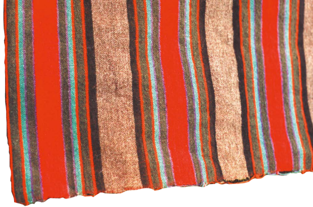
Fellplagg frå "nedi" Eggen, Vestatæ, Alvdal. (Foto: forf.).

plagga i innslagseffekt, og mønsteråklea i skillbragd, seg ut. Innan skillbragd finn ein her to typer, "rutåklæ" vove på seks skaft og "spelåklæ" vove på ti skaft. (Spelåklæ er eit uttrykk som eg har høyrd nemnd og som ikkje er stadfesta, men som fleire synes er ei rimeleg nemning).