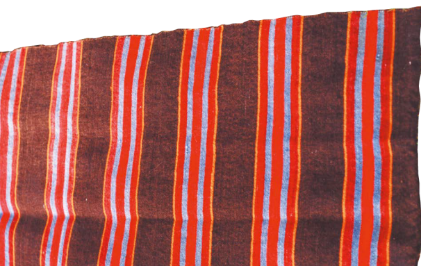
Fellplagg frå Folshaugmoen, Folldal. (Foto: forf.).