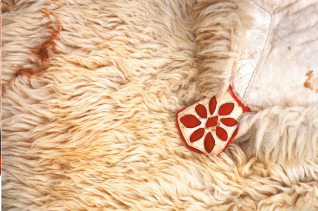
Fell-lapp etter Håkon B. Strømsås.

Fellplagga var oftast svarte, eller grå i botn. Raudt, grønt, gult, brunt og blått var brukt i stripene, og i dei smale stripene skarpe fargar som fiolett, blått eller orange. Grått og svart var det naturleg tilgang på, medan dei andre fargane måtte fargast.