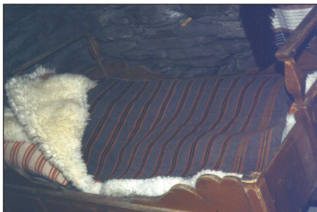
Seng oppreidd med bost i botn, underfell oppå. Hovudpute og sauskinnfellen med "åbretle" over. Dette var ofte sydd fast på fellen. Frå utstilling ved Museumssentret Ramsmoen. (MiNØ 14592).