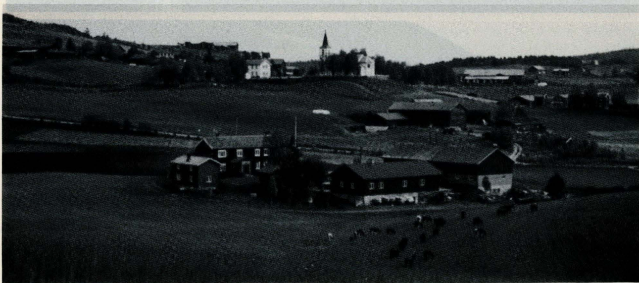
Kulturlandskap i Vingelen med ca. 80 års mellomrom. I forgrunnen Jordet og Trøen, med kirka, skolen og Røsgrenna i bakgrunnen.