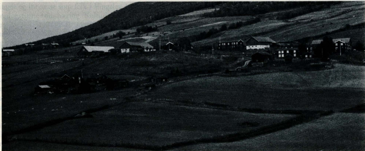
Kulturlandskap i Vingelen med ca. 80 års mellomrom. I forgrunnen Nyhusa og Ousta, begge gardar der jorda nå er tilleggsjord, ellers f. v. Tøllefsa, Nordistuen, Åkeren og Vingelsgarden.