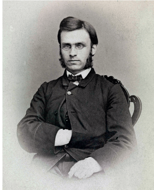
Johan Storm 1863-1865.

privat boksamling på ca. 6500 bind. Den besto hovedsakelig av litteratur om romanske språk. Etter hans død ble boksamlingen solgt til Bergens Museums Bibliotek.