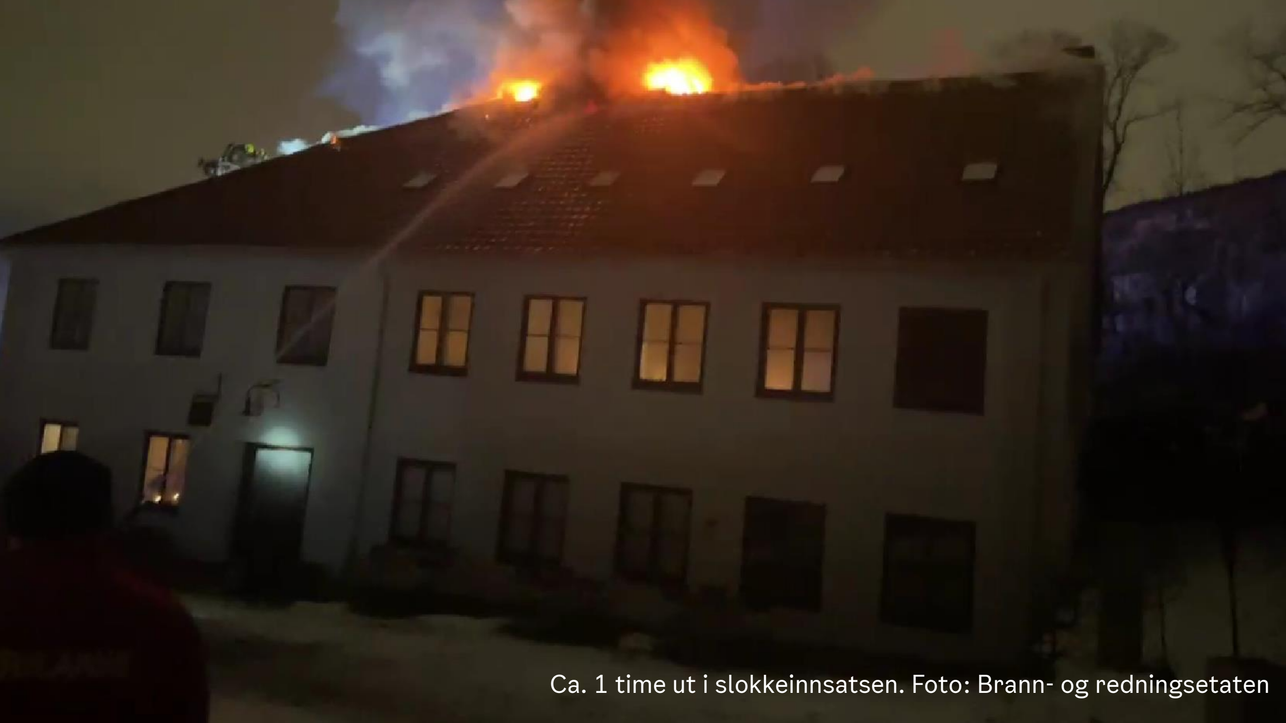
Ca. 1 time ut i slokkeinnsatsen.