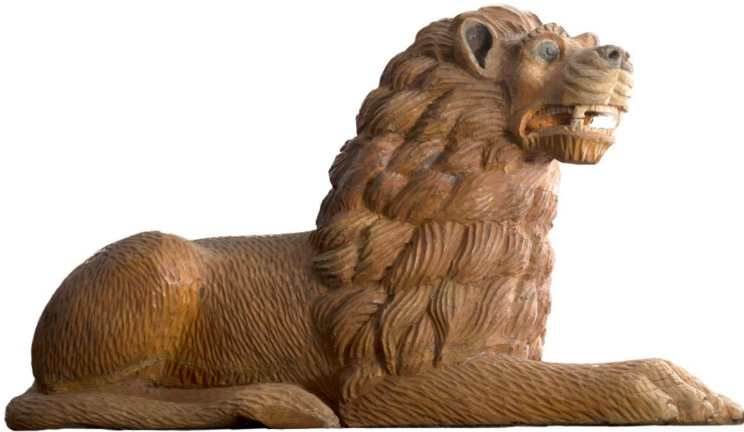
NFA.16775. Emblem fra Løveapoteket i Trondheim.

Sikkerheten ved NFM skal følge SNFs sikringsplan. Denne omfatter per i dag (2017) ikke sikring av samlingene. Arbeidet med å komplettere SNFs sikringsplan vil fra stiftelsens side bli prioritert i kommende periode. Sikringsplanen vil blant annet omfatte sikring av objekter i stiftelsens samlinger, både magasinerte og utstilte, evakueringsplan og evakueringslister for gjenstandssamlingen mv. Styret i NFM vil i denne forbindelse bli involvert ved å ta stilling til hvilke gjenstander som skal sikres først fra de ulike deler av Generalitetsgården ved en krise.