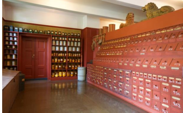
Store deler av samlingene vises gjennom utstillingene, som offisinet fra Apoteket Hjorten og materialkammeret.