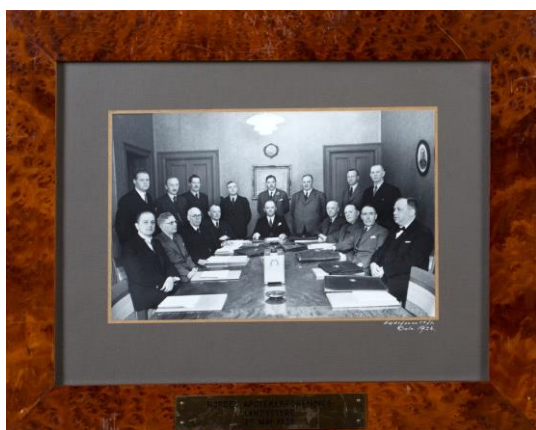
NORGES APOTEKERFORENING'S LANDSSTYRE 25.MAI 1936 NFA.18564.

Henvendelser om gaver i form av foto som ønskes donert til museet blir løpende vurdert.