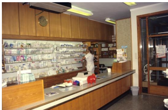
Interiør fra Vikersund apotek 1990. NF.32581-007

NFM har en fotosamling som omfatter foto av både apotek, personer oa. Den største enkelt-samlingen består av en stor samling dias, negativer og kopier på papir fra Apotekforeningen (tidligere Norges Apotekerforening) som museet mottok i 2008. Samlingen stammer fra Bygge- og innredningskontoret i Norges Apotekerforening (senere NAF-gårdene AS). Den dekker i hovedsak tidsrommet 1970 til 2001 og dokumenterer ombygginger og nyanlegg av norske apotek i denne perioden. Samlingen er scannet og registrert i Primus Foto.