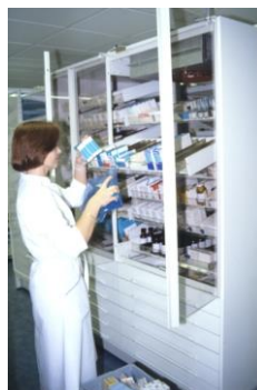
Interiør fra Stokke apotek 1986. NF.32296-024

Også mer sporadisk bildemateriale har vært samlet inn eller gitt som gave til museet. Materialet er blitt løpende scannet og registrert og er plassert i klimaregulert fotomagasin (sentralmagasin).