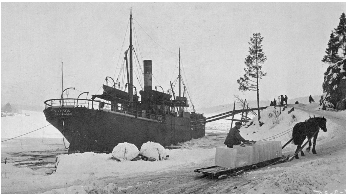
Det internasjonale forskningsprosjektet «The last Ice Age» ble avsluttet i 2022. Bildet viser DS Firda som laster is i Leangbukta i Asker i 1925.