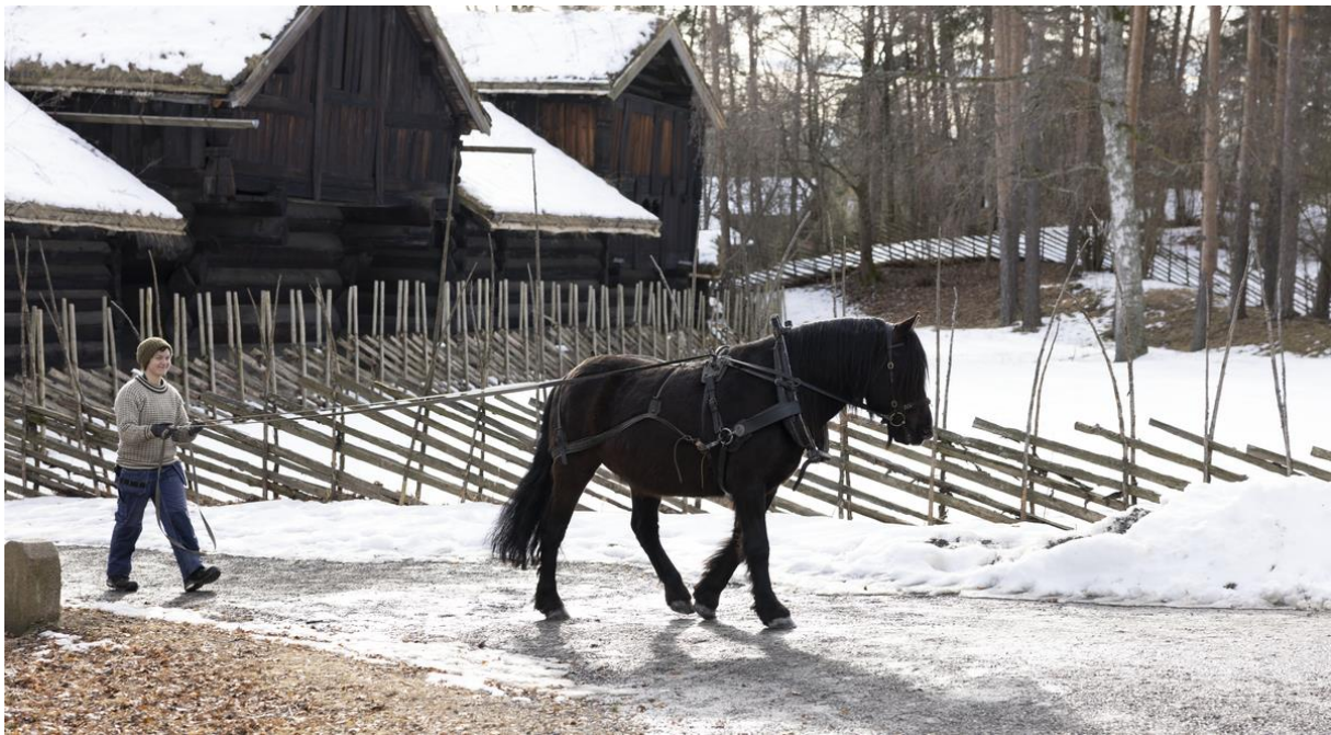
Lanbrukstunvertene bruker hest i mye av arbeidet på Norsk Folkemuseum.