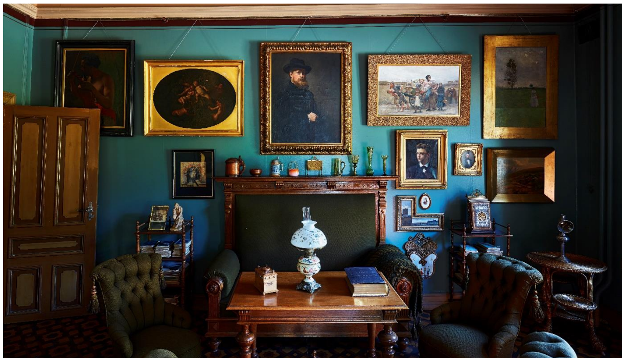
Ibsens leilighet har vært stengt for publikum på grunn av manglende midler til drift.