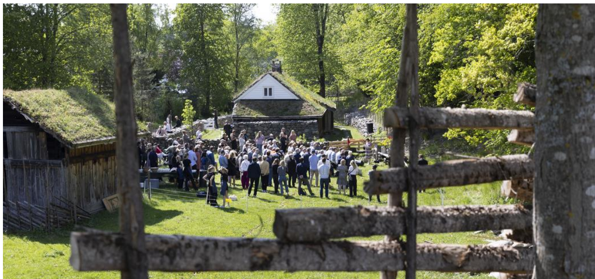
Busslaster med besøkende fra Jæren kom til åpningen av Lendestova 20. mai.