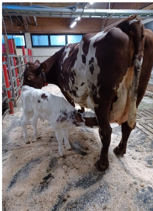
Ku og kalv i fjøset.

Statsbygg har gjort en stor jobb med total utskifting av ventilasjonsanlegget i fjøset. Avtrekksvifter og luftblandere ble byttet og alle luftehattene på taket ble bygd nye. Dette har ført til et bedre luftklima i fjøset for kuene og har bidratt til et bedre arbeidsmiljø for de ansatte da de nye viftene lager vesentlig mindre støy enn de gamle.