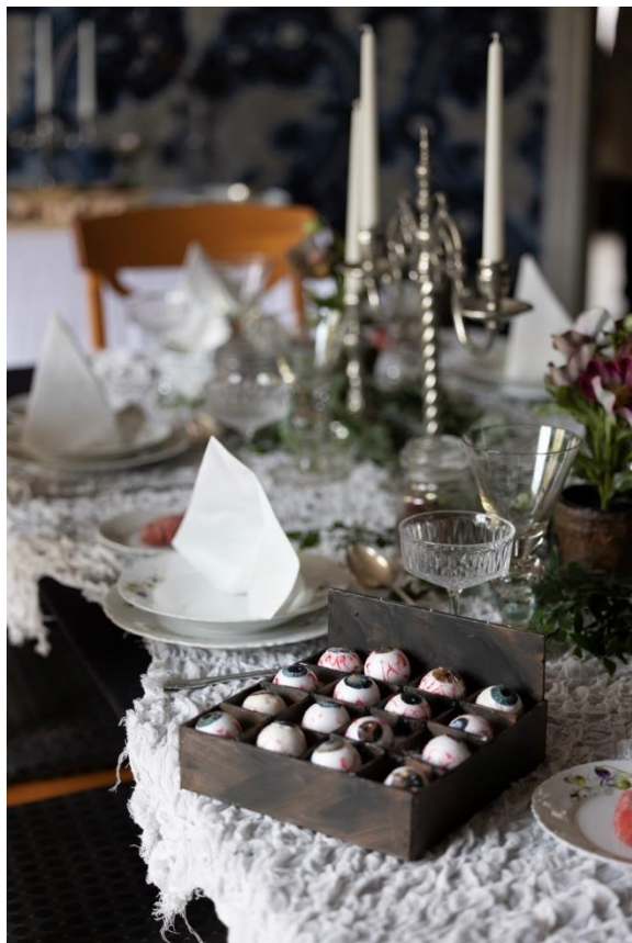
Svart natt var et samarbeid med elever fra Elvebakken VGS.

Norsk Folkemuseum er et av Europas største og eldste friluftsmuseer og et nasjonalt kulturhistorisk museum. Museet formidler, forvalter og bygger historisk kunnskap om menneskers liv fra 1500-tallet og fram til i dag. I tillegg til bygninger fra hele perioden, har museet faste utstillinger innen blant annet draktskikk, folkekunst, kirkekunst, samisk kultur, bykultur og leketøy. Museet er organisert i fire seksjoner; bygningsantikvarisk, kulturhistorisk, formidling og drift.