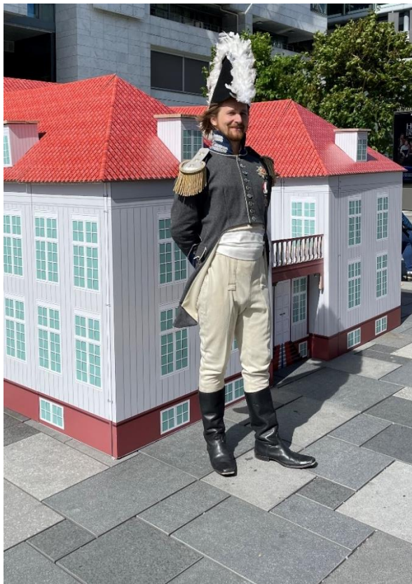
Eidsvollsbygningen i papp, plassert på Aker Brygge.

Eidsvoll 1814 er som kulturminne og museum en egnet arena for samtaler og markeringer. Så tidlig som 1. mars la museet til rette for fredsmarkering mot krigen i Ukraina. For å rette fokus mot 50-årsjubileet for legalisering av homofili, lot vi kulturministeren heise pride-flagget på jubileumsdagen 21. april. I tillegg var vi vertskap for den internasjonale FIHRM-konferansen 2022 med temaet Museums under pressure med deltakere fra hele verden, som også involverte trusselutsatte museumsansatte fra hele verden i september. Den 27.juni var vi dessuten vertskap for det nordiske finansministermøtet 2022.