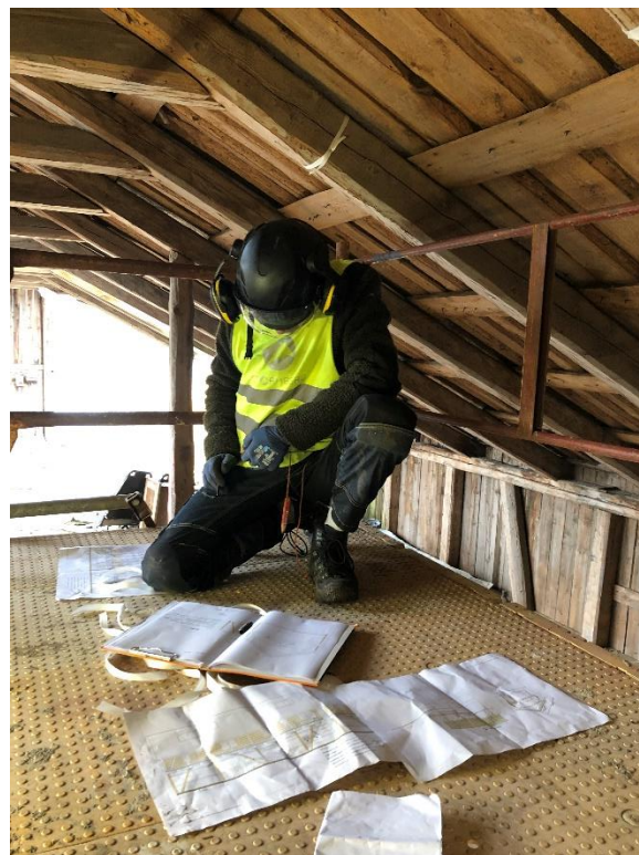
Inspeksjon av ombruksmaterialer fra Sem gård i Asker, som skal brukes til Tradlab Tre.