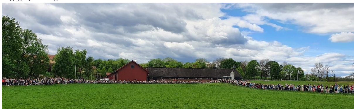
Kuslippet i 2022 trakk 6000 besøkende.

Gartnerne og museumsbøndene har som vanlig stått for skjøtsel av arealene og driftet husdyrholdet i friluftsmuseet. Av formidling knyttet til vår drift i friluftsmuseet kan nevnes hagevandring, ferieskolens landbruksaktiviteter og tilbudet om åpent fjøs i Trøndertunet. I hele høysesongen har det vært arrangert daglig dyreførrunde i friluftsmuseet.