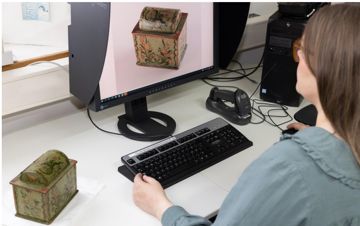
Katalogisering av gjenstander fra Nordiska Museet.

2022 arbeidet med revisjon av stiftelsens samlingsforvaltningsplan med mål om å utvikle stiftelsens interne "Håndbok for samlingsforvaltning".