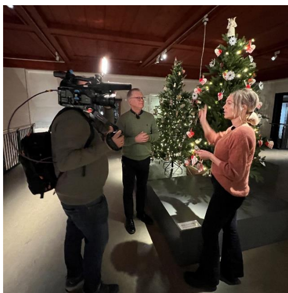
Direkte på God Morgen Norge på TV2 før jul.

For å jobbe med økt oppmerksom og kjennskap er det behov for å videreutvikle og fornye kommunikasjonsuttrykket på flere av museene. Kommunikasjon skal bygge på strategi og målsatte posisjoner. Kommunikasjonen skal øke preferanse, drive penetrasjon og frekvens. Det målsettes å lansere ny kommunikasjon for flere av museene i 2023.