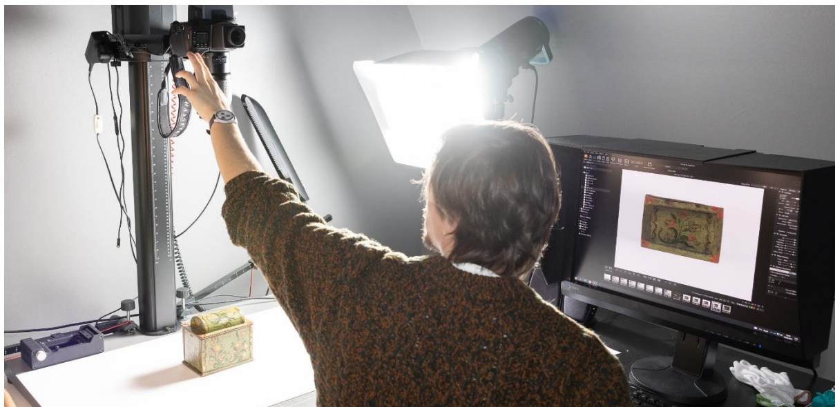
Dokumentasjonsavdelingen fotograferer gjenstander fra Nordiska Museet i Stockholm.