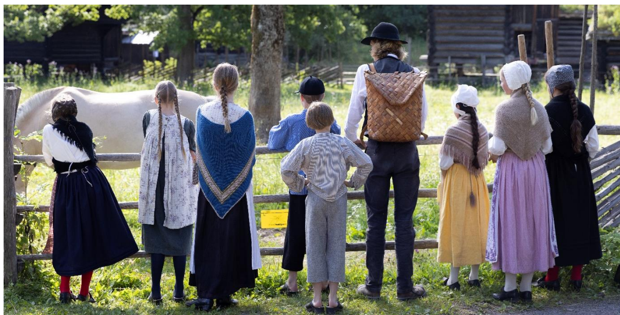
Historisk ferieskole.

Nøkkeltall er hentet fra innrapportert museumsstatistikk