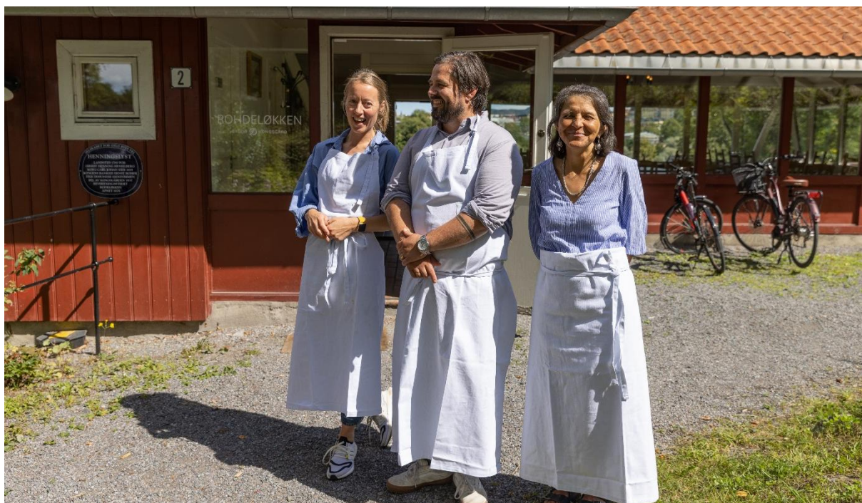
Rohdeløkken Kafé ble nyåpnet 5. august, og er nå for første gang en del av Kongsgården.