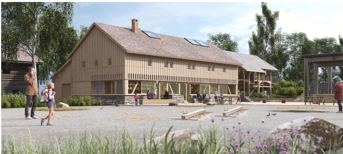
Slik skal TradLab Tre se ut om noen år. I 2022 startet arbeidet med å hente materialer. Illustrasjon: Olav Vidvei