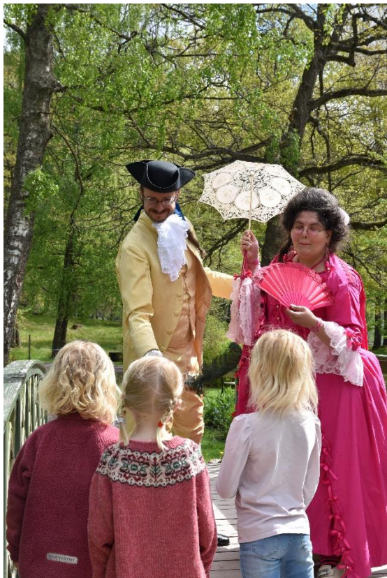
Bogstaddagen trakk store og små til den historiske parken 22. mai.

Av formidlingsaktiviteter ut over det ordinære omvisningsprogrammet kan nevnes at vi også for 2022 har gjennomført programmer innen både den kulturelle spaserstokken og den kulturelle skolesekken. Vi har også gjennomført klassiske intimkonserter i salen i Hovedhuset med en lite, men meget begeistret publikum.