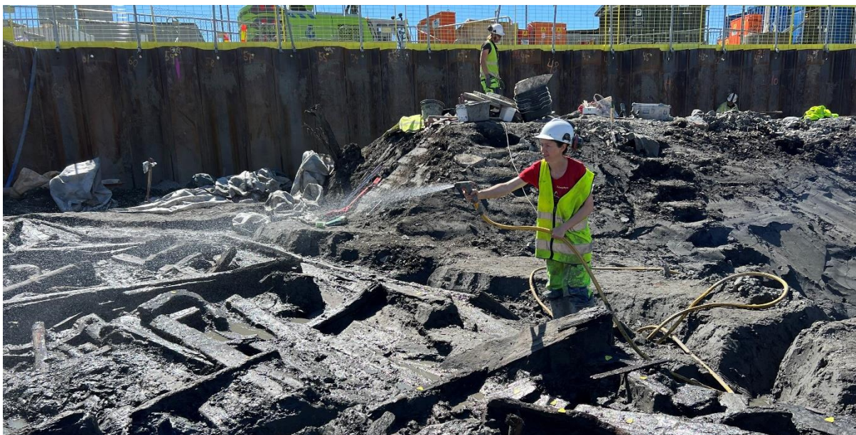
Fleire båter ble funnet under utgravningene i Bispevika i 2022.