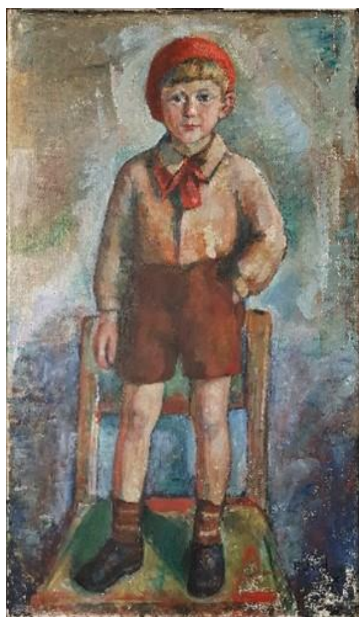
Gutteportrett under og etter konservering.