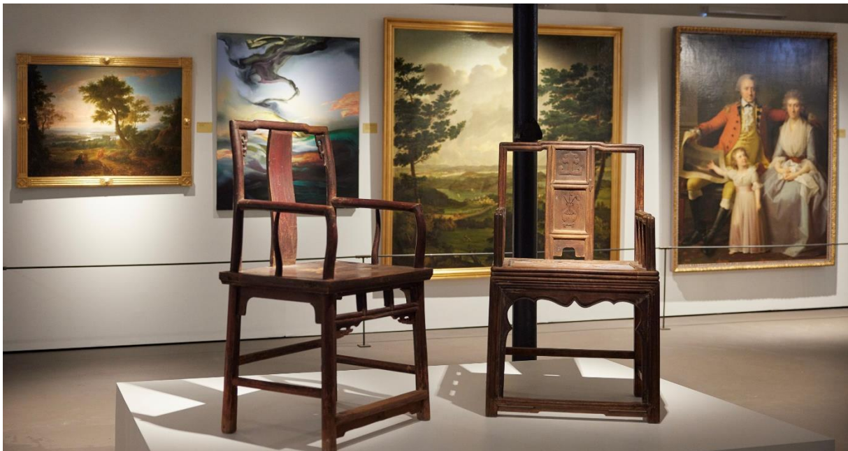
Galleri Østfløyen åpnet for publikum 30. september med utstillingen «Kunstsamlerne».