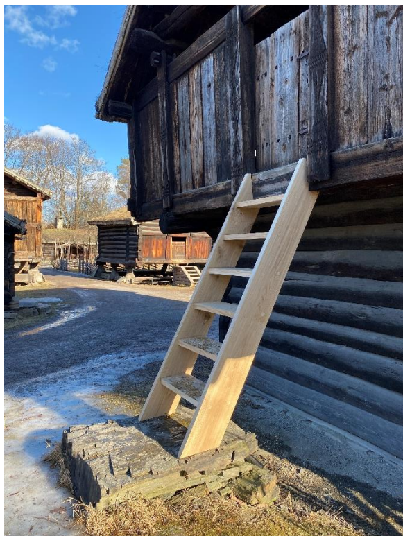
Nye trapper til loft i Friluftsmuseet.

Vi har fått et Byggdrifterfagbrev i løpet av året og 3 renholdere besto teorieksamen og er klare for sin fagprøve i 2023.