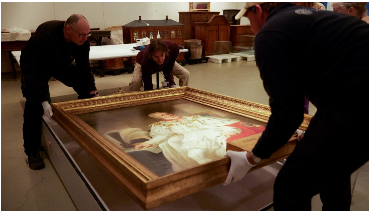
Serafimerportrettet på vei til konservering før utstilling på Bogstad.