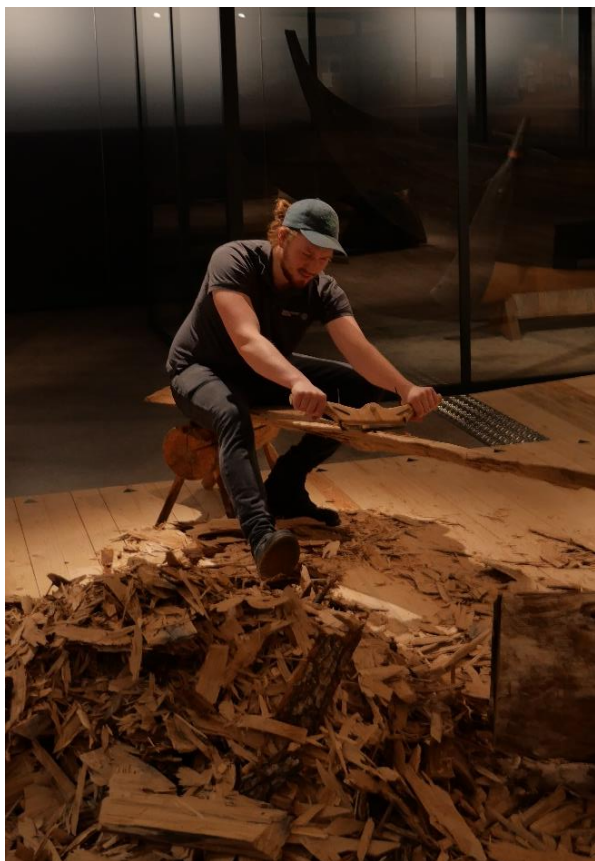
KLINK åpnet 17. juni 2022. Her skal det bygges en replika av Gogstad-båten.