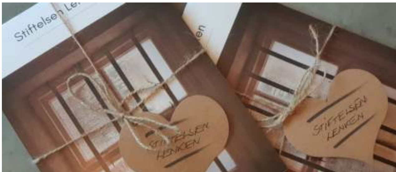
Brosjyre Stiftelsen Lenken.

Espeland fangeleir og Gestapomuseet ble samlet i en felles stiftelse i 2020. Slik ville vi etablere et episenter for historiebasert freds- og menneskerettighetsarbeid i vestlandsregionen, spesielt rettet mot ungdom.