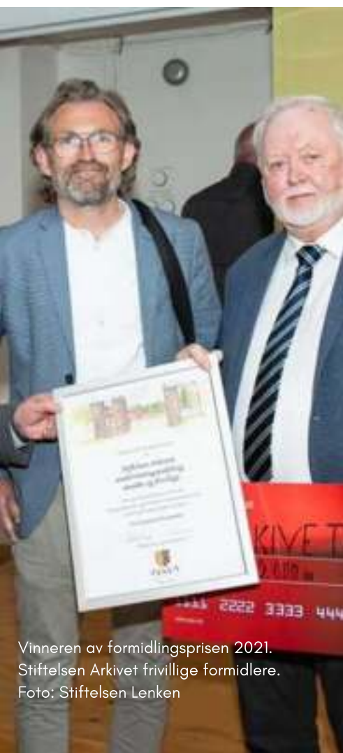
Vinneren av formidlingsprisen 2021. Stiftelsen Arkivet frivillige formidlere.