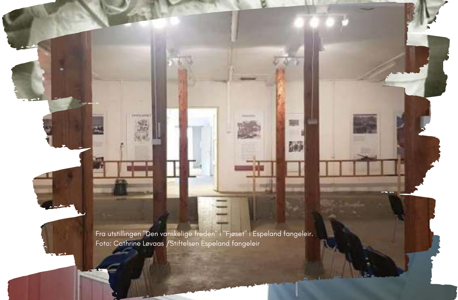
Fra utstillingen "Den vanskelige freden" i "Fjøset" i Espeland fangeleir.