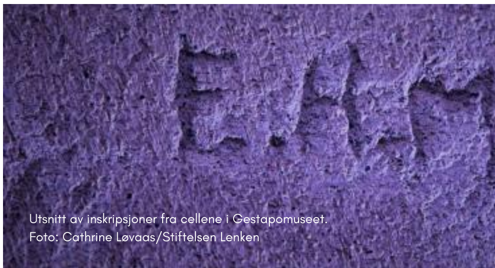
Utsnitt av inskripsjoner fra cellene i Gestapomuseet.