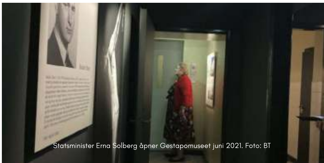
Statsminister Erna Solberg åpner Gestapomuseet juni 2021.