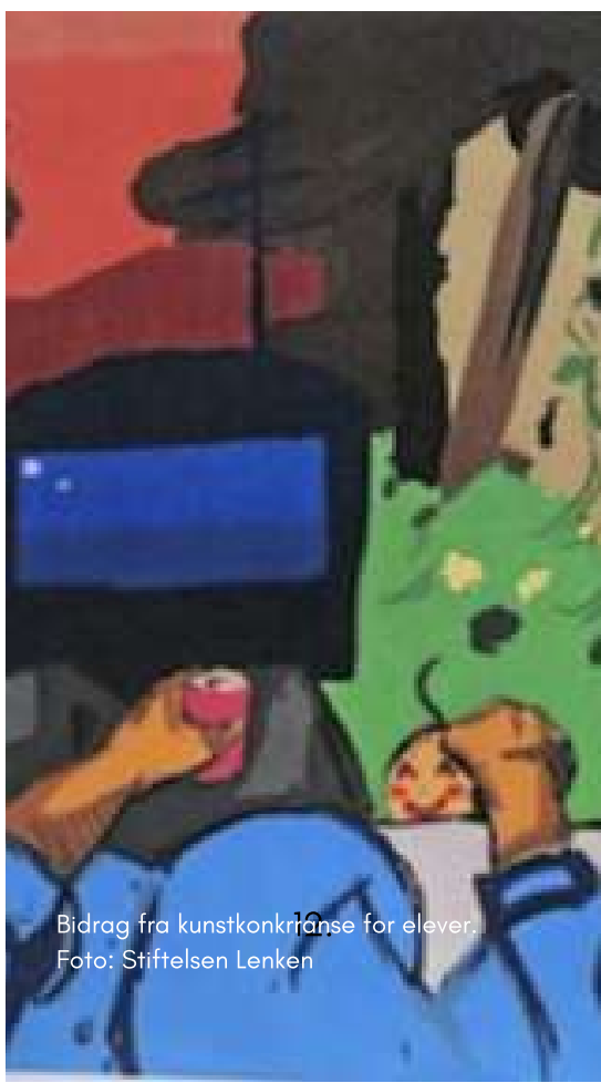
Bidrag fra kunstkonkrranse for elever.