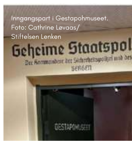
Inngangspart i Gestapomuseet.