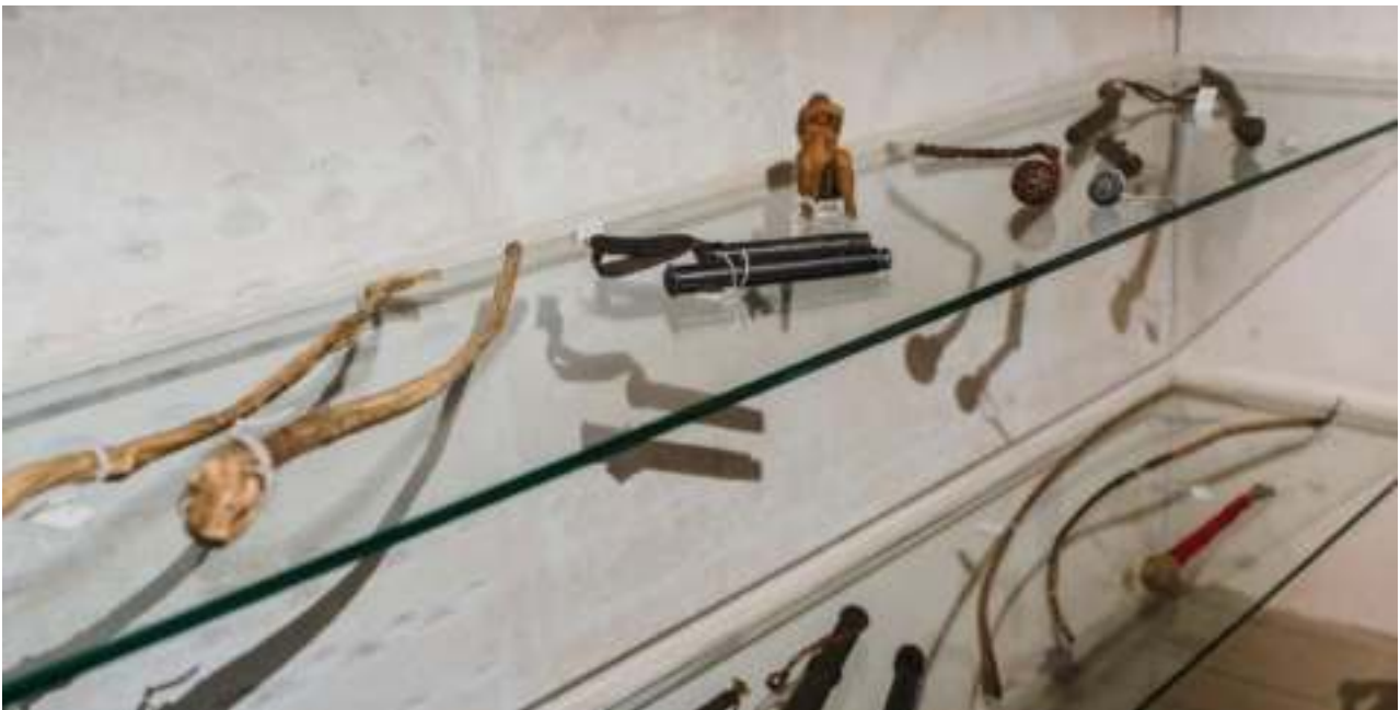
Utstilling i Gestapomuseet.

Når vi nå står klar for neste trinn og ber om økte statlige tilskudd, blir også en øket støtte fra Bergen kommune og fylket et desto viktigere signal. Om ikke annet ga pandemien oss rom og tid til å tenke fremover og legge gode strategier.