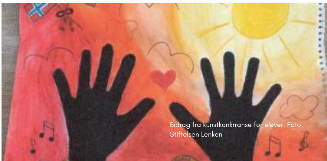
Bidrag fra kunstkonkrranse for elever.