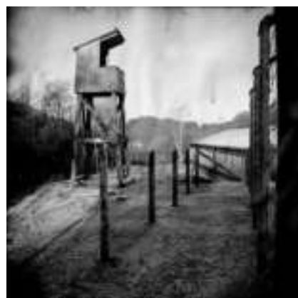
Vaktårn i Espeland fangeleir.