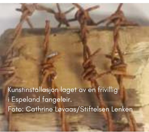
Kunstillasjon laget av en frivillig i Espeland fangeleir.