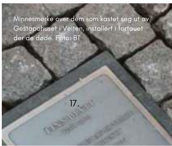
Minnesmerke over dem som kastet seg ut av Gestapohuset i Veiten, installert i fortauet der de døde.