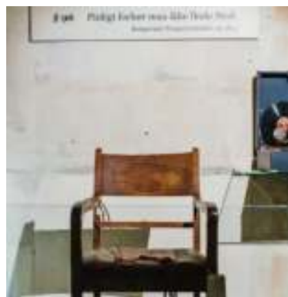
Utstilling i Gestapomuseet.

Etter krigen internerte leiren norske landssvikere og fra 1948 samtlige tyske krigsforbrytere (med ett unntak). Da Sivilforsvaret overtok anlegget i 1952 ble det en del av «den kalde krigen». I november 2014 ble leiren fredet, og noen måneder senere overdro staten anlegget til stiftelsen. Leirens målgruppe er i særlig grad skoleelever på 9. trinn.