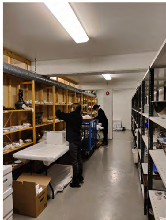
Pakking av keramikk på KODE1