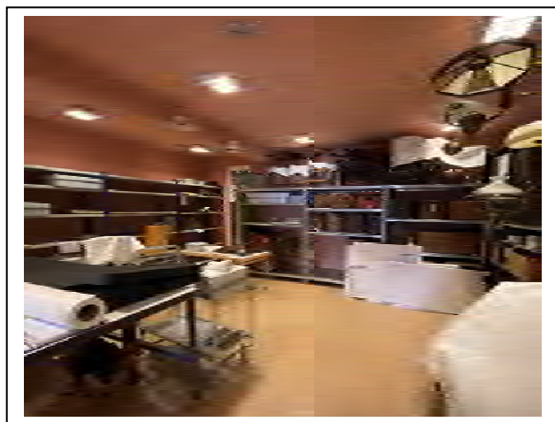
Før og etter re-org i gjenstandsmagasinet

Magasinet er ikkje fullstendig omorganisert med dette, men vi har føreslått ei rekkje mindre tiltak som kan gjerast utover vinteren. Då vil ein lokalt også få oversyn over større tiltak som bør arbeidast meir med. Kan hende endar dette i eit nytt samarbeidsprosjekt neste år. At vi ikkje ser oss ferdige viser at samlingsforvaltning er ein kontinuerleg prosess som aldri kan sjåast på som fullført.