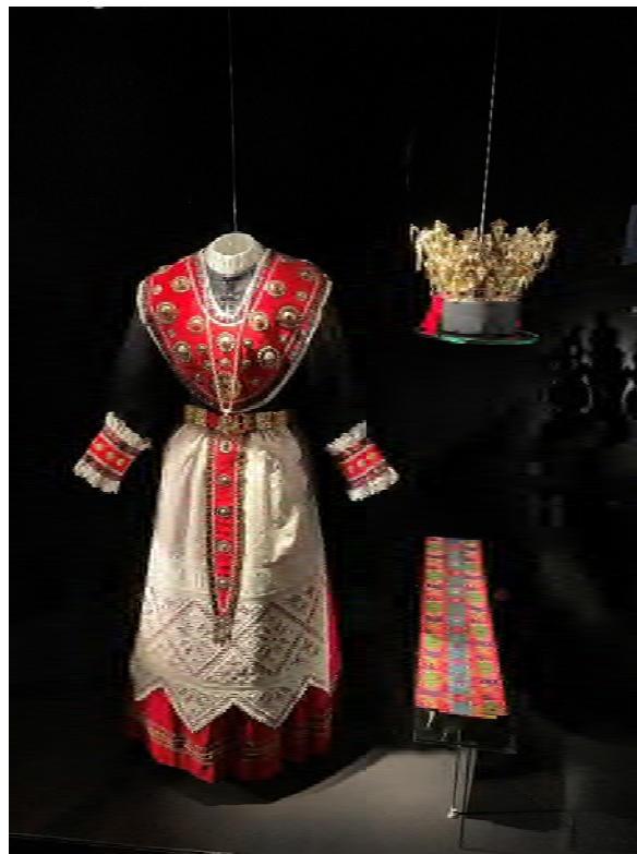
Utstilling av brurekrone og bunad på Kystmuseet i Øygarden

Vi har konserverert ei brudekrone og ein bunad som no står utstilt på Kystmuseet i Øygarden. Vi har konstruert ei støtte og montert drakta på ein måte som gjev eit inntrykk av korleis den ville ha sett ut i bruk.