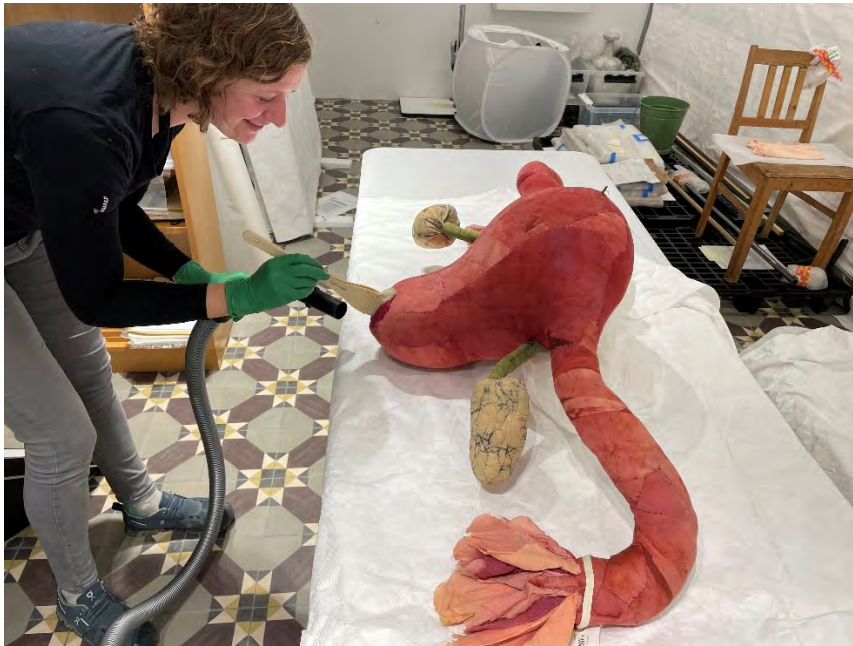
ReOrg i tekstilmagasinet på Kode

Vi sette opp insektfeller på alle KODE sine bygg i september, og dette er eit første steg til å få eit godt oversyn over insektsituasjonen i heile KODE.