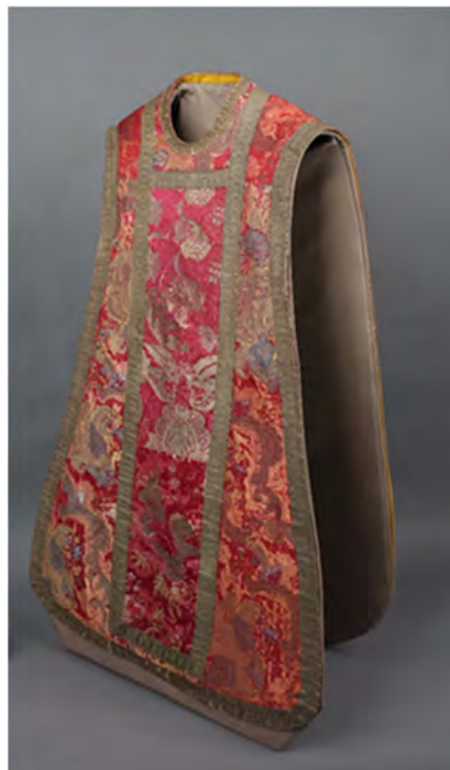
Messehaket etter konservering, med støtte for utstilling