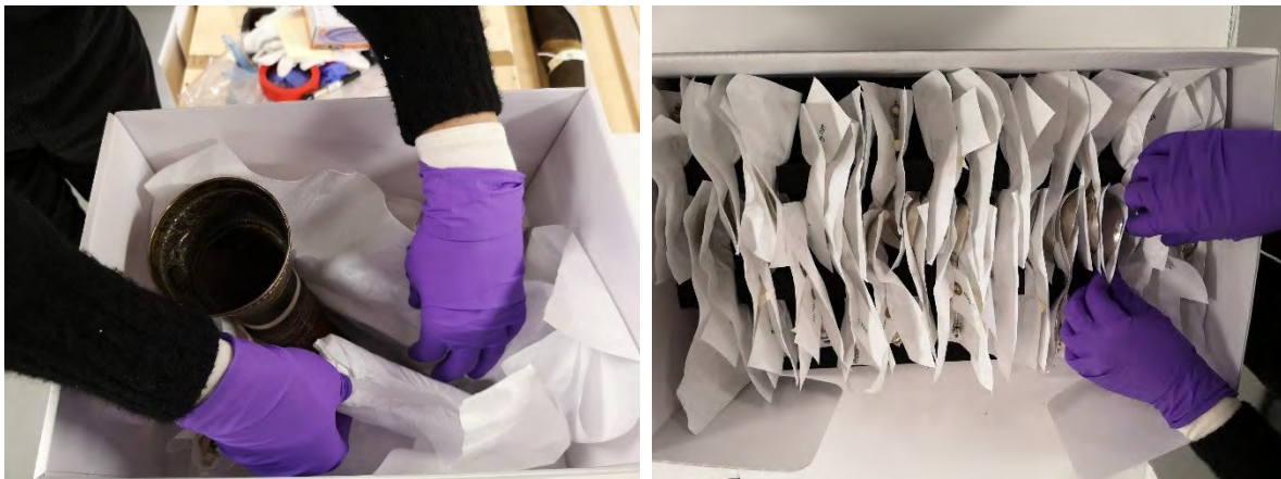
Pakking av sølv på KODE

Eit stort prosjekt i KODE er pakking av gjenstandar som skal flyttast ut frå KODE 1. Våre gjenstandskonservatorar var på museet i fire veker og pakka ulike gjenstandar frå sølvsamlinga. Gjenstandane er flytta til Salhus, tilstandsvurdert og flytta inn i fellesmagasinet.