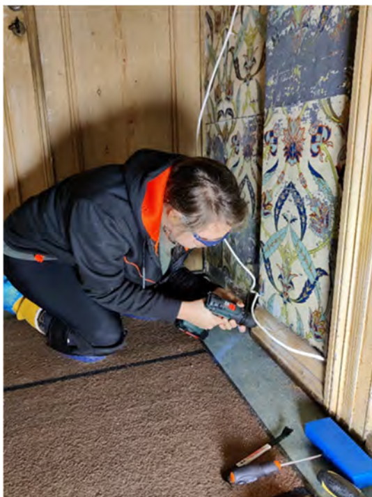
Demontering av plater av blikk på Lysøen

KODE har to store prosjekt dei komande åra, nemleg restaurering av Lysøen-villaen og innflytting i det nye magasinet på Kokstad. Vi har delteke på fleire møte om den planlagde restaureringa av Lysøen-villaen, og har kome med råd og innspel i planarbeidet. I september starta arbeidet med å førebu flytting av gjenstandar ut av villaen. Mellom anna utførte vi tilstandsvurdering og sikring av gjenstandar før transport. Vi deltek på digitale planleggingsmøte kvar veke saman med prosjektleiaren for Lysøen. Arbeidet med å klargjere gjenstandar for utflytting av villaen er i gang. Mellom anna utfører vi tilstandsvurdering og sikring av gjenstandar. Gjenstandskonservatorane har fjerna og pakka emaljerte blikkplater som var ein del av ein dekorativ veggdekorasjon i inngangspartiet. Platene var i svært ustabil tilstand, difor var det spesielt viktig å få fjerna og sikra dei. Tekstilkonservatorane har pakka ned to portierer og eit flygelteppe for å hindre at dei vert skada under pågåande arbeid i villaen.