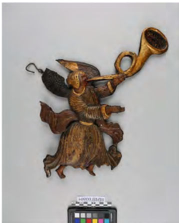
Gjenstanden er konservert i samband med filminga av prosjektet «Bevar meg vel!».

I samband med prosjektet “Bevare meg vel” deltok vi i innspeling av filmen om restaureringa av Finnegården på Hanseatisk museum. Filmen set lys på museet sine samlingar og arbeidet som vert utført bak kulissene i museet for å klargjere gjenstandar til utstilling. I filmen snakka vi om konservering av ein englefigur som er laget av formpressa metallplater. Englefiguren har tidlegare hengt frå taket på stuen i Finnegården og er truleg ein av dei første gjenstandane museet samla inn. Engelen er no ferdig konservert og ventar på å få nytt oppheng til utstilling.