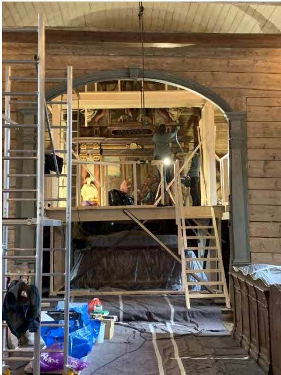
Housekeeping i St. Jørgens kirke

desse. Arbeidet i kyrkja blei filma av tilsette frå Tekstilindustrimuseet og dei har produsert ein liten film til MUHO si facebook-side.