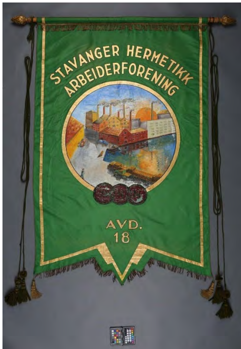
Ei av fanene frå Norsk Hermetikkmuseum

Eit teppe frå ein privat kunde er reingjort og pakka for magasinerings. Vi har også konservert ein messehaket frå ein privat kunde, og laga ei støtte som messehagelen kan stillast ut på.