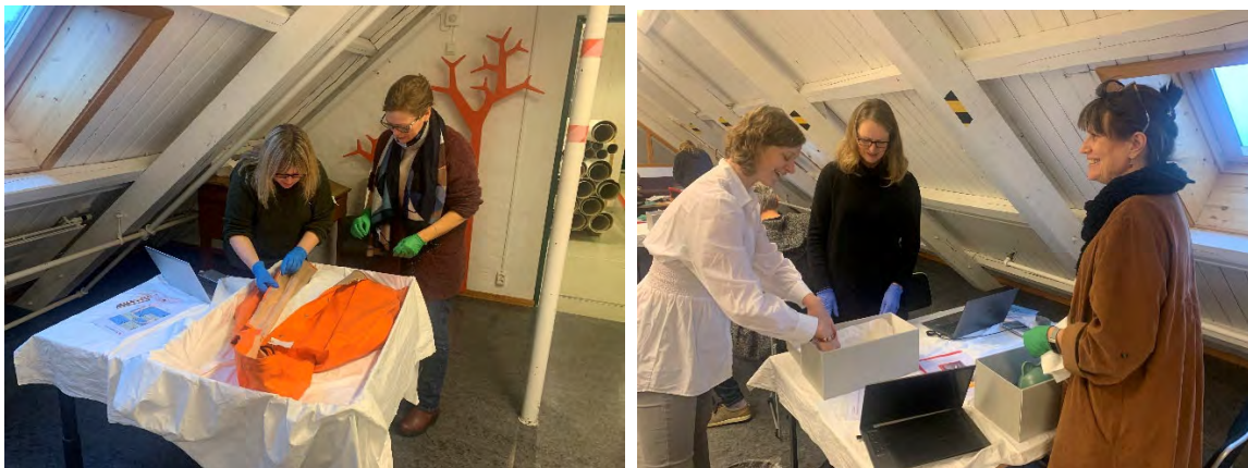
Tilsette frå Bymuseet og Museum Vest på plastkurs

Bevaringstenestene har utvikla fleire kurstilbod innanfor dei fagfelte vi dekkjer. Våren 2021 var eit nytt kurs klart, denne gongen om bevaring av plastgjenstandar i samlingane. Vi hadde ei utprøving av kurset for deltakarar i Museum Vest, og hadde så to ordinære kurs i november for tilsette frå KODE, MUHO, Museum Vest og Bymuseet.