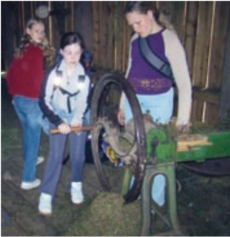
Lyngen vert kutta med ein halmkuttar før kyrne et fóret.