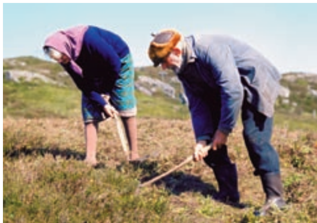
Det var vanleg å slå lyngen med stutturv.

Utandyring kjem så degenereringsfasen som varer frå 25 - 40/50 år. Planten er no så vedaktig at han har liten eller ingen verdi som beiteplante. Derksom ikkje lyngen då vert svidd av, vert lyngheiane etterkvart invaderte av einer, lauvtre og furu slik at ein får skog.