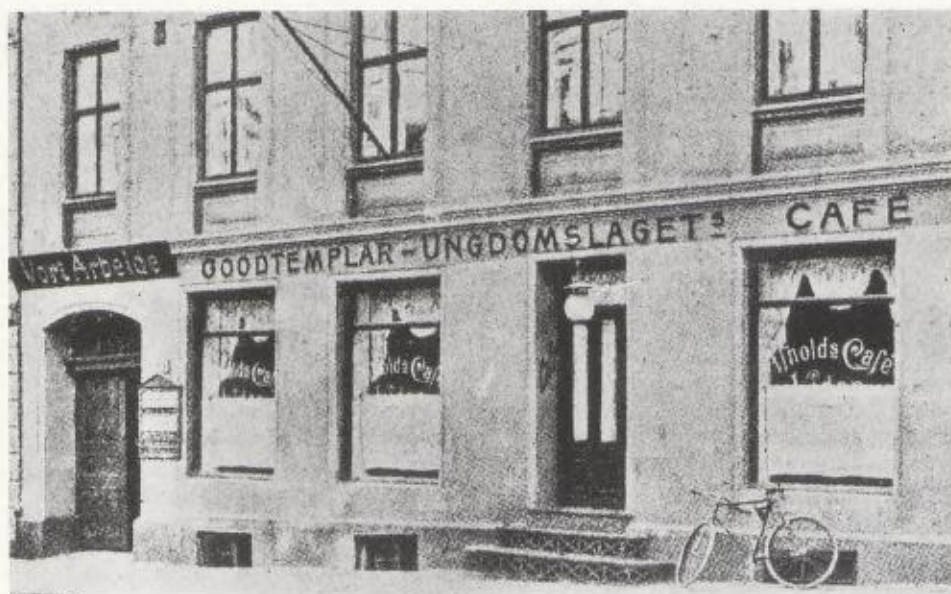
Goodtemplar-ungdomslagets café «Vidar» i Bernt Ankersgate, ca. 1920.

publikum. Bare i årene 1918-1924 oppførte «Hauken» 60-70 forestillinger.