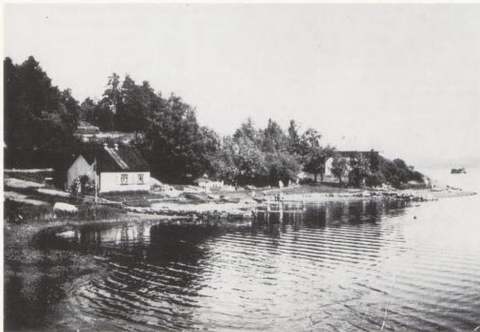
Oslo Godtemplarungdomslags sommerhjem Kirkevik, Presteskjær i Bundefjorden, ca. 1950.

meter strandlinje. Det sto et par bygninger på tomta og medlemmene bygde senere to hus til - et allerede i 1928, et på midten av 50-tallet.