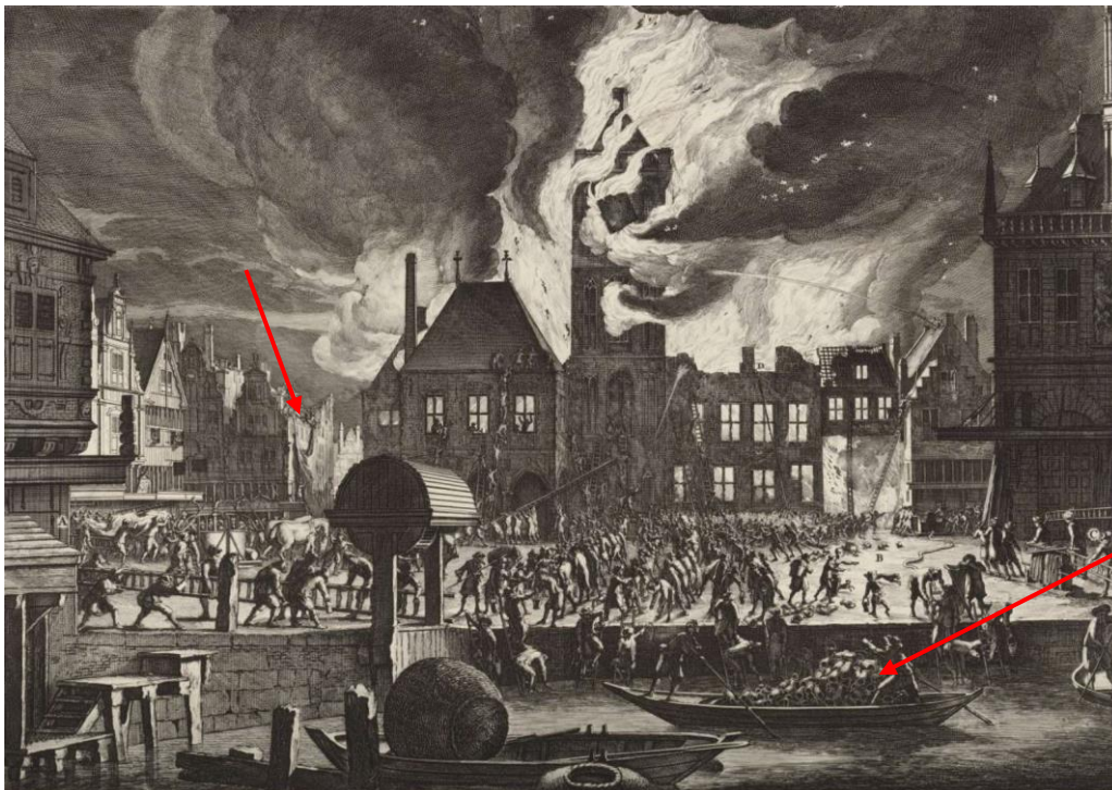
Figur 3 Etsning av Jan van der Heyden (1652): De brand in het Oude Stadhuis van Amsterdam. Her sees personbasert innsats som var mer vanlig før, med fylling og løping med brannbøtter og tildekking av fasader til venstre i bildet (se piler).