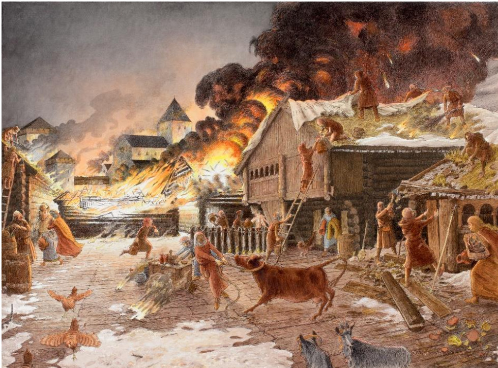
Figur 2 Tildekking av trebygg for å hindre brannspredning og antennelse. Av Keller/Schia. Riksantikvarens arkiv.

I Den Gamle By i Aarhus, Danmark, ble det i desember 2019 utført tester på brannbeskyttende tekstiler (pers. komm. Lisbeth Præstegaard m.fl. 14.12.2020). Arbeidet ble ledet av konservatorer fra Den Gamle By og Bevaringscenter Nord). Målet var å undersøke virkningen av ulike typer tekstiler for beskyttelse mot brann for museets interiør og de tunge gjenstandene som vanskelig lar seg berge. Forsøket ble utført med 8 ulike overtrekk på stoler i en realistisk brann med etterfølgende slokking. Foreløpige resultater viste at de ulike tekstilene beskyttet svært forskjellig, og resultatene skal publiseres.