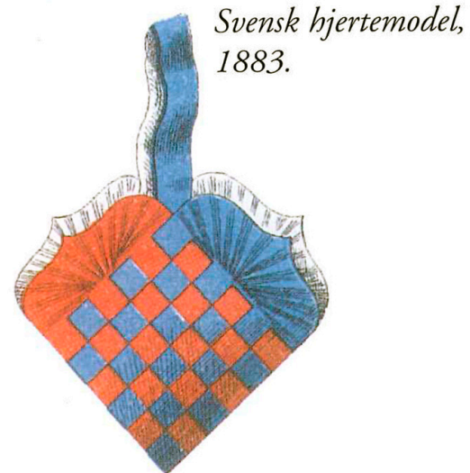
Illustrasjon fra den første svenske publikasjon fra 1883 med tekst og bilder for bruk i hjem og skole, med anvisning til hvordan man fletter en juletrekurv. Det spesielle med illustrasjonen er den pliserte enden vi kjenner igjen fra søskenparet Munchs ene juletrekurv.

voksne liv, men i kraft av seg selv være en viktig del av selve livet. Barnets evner skulle utvikles både åndelig og menneskelig gjennom å leke. Til de ulike disiplinene han forfektet hørte papirfletting, hvor et ark med glanspapir skjæres opp, et annet skjæres i strimler, som igjen flettes inn i det første arket lik en vev. Deretter kunne de ferdig flettede ark bearbejdes til nyttige og dekorative gjenstander som kurver, esker med mer. Herfra var ikke veien lang til flettede juletrekurver. Som allerede nevnt var utgiveren av den eldste kjente veiledning for fletting av juletrekurver fra 1871 utdannet lærer. Tilsvarende var den første svenske publikasjonen om juletrekurver fra 1883 beregnet på bruk i hjem og på skoler.