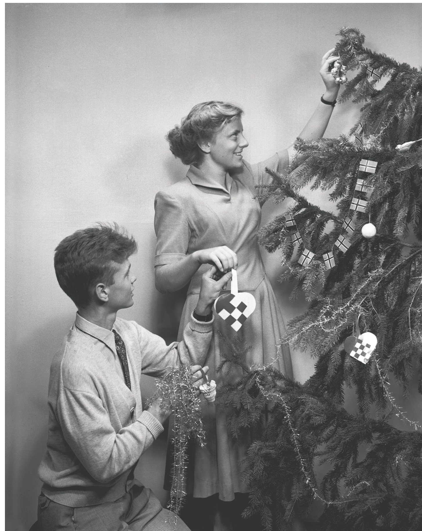
Her pyntes juletreet i 1950-årenes Oslo med juletrekurver i farget glanspapir.