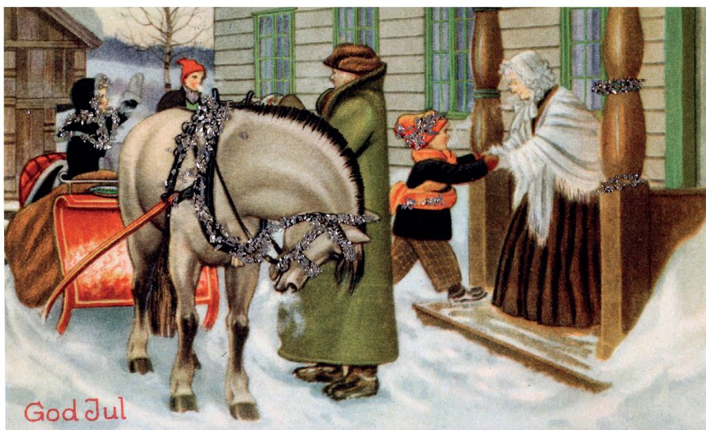
Julekort med nissar var best, vaksenkort med landskap og hus var kjedelig. Frå Sverresborg Trøndelag Folkemuseum.

kulørte kuler, til og med elektriske juletrelys! Ein kunne gle seg over vindusutstillinga, med nissar på kvit vatt, og ikkje minst