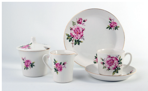
Femtitalsservise frå norske fabrikkar er samleobjekt i dag.

Eg hadde gått og sett på ei skål som eg syntes var så fin, den fekk eg gi mor i gebursdagsgave. Skåla var i simpelt pressglass, og gjorde teneste i mange tiår.