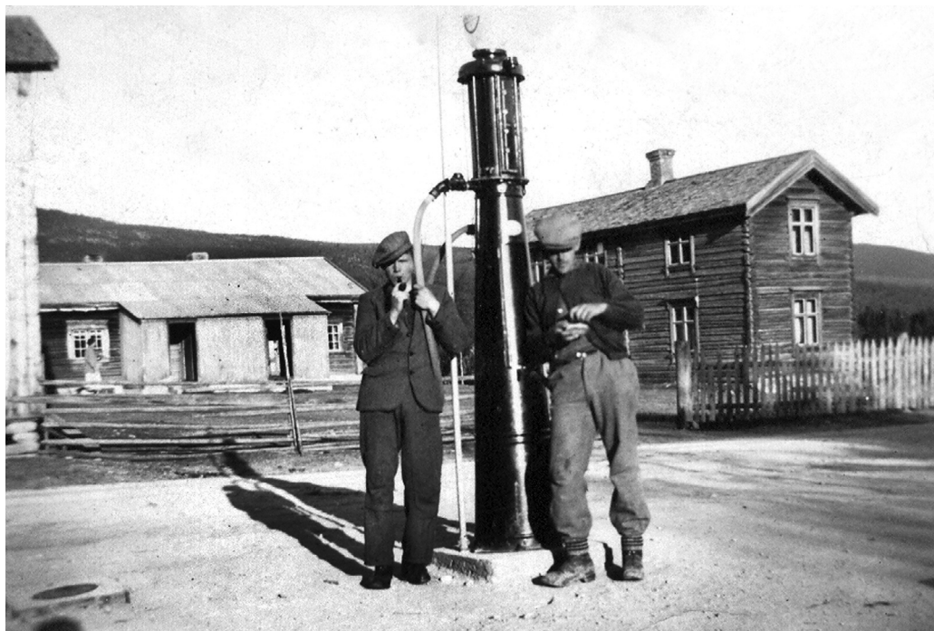
Ei tidstypisk bensinpumpe. Her frå Sanakerbutikken på Elvål i Rendalen. (MINØ.140733)

syklane. Men Per Post måtte jo ha drivstoff til motorsykkelen i all slags vêr – posten skulle fram.