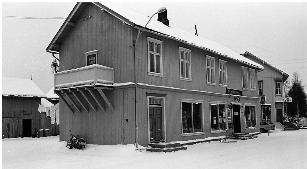
Os Landhandel var eit staselig bygg i si tid. Saman med jernbanestasjonen, banken og Fensal var huset ein del av den nye stasjonsbyen. (MINØ.1455)

Vel innafor døra kunne ein ta det store lokalet i augesyn. Der fans det mye rart! Under taket hang kjøkkenreiskap og annan