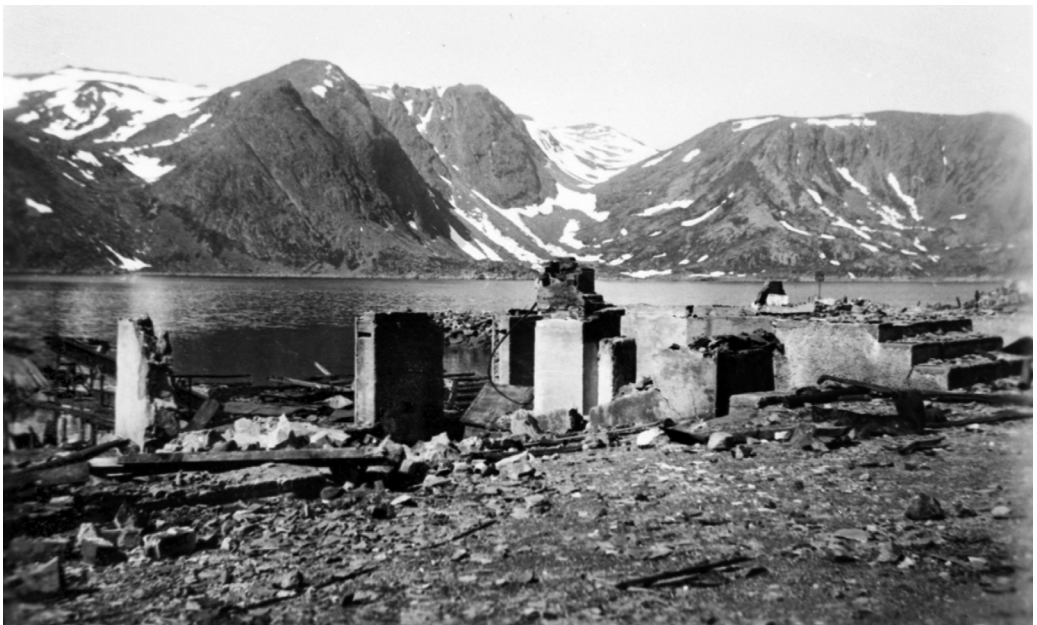
Den tyske okkupasjonsmakta gjennomførte brent jords taktikk med hard hånd i Finnmark. Her fra Honningsvåg.

Mange måtte sjå på at tyskerne avliva husdyra og satte fyr på husa. Karstein Dam-